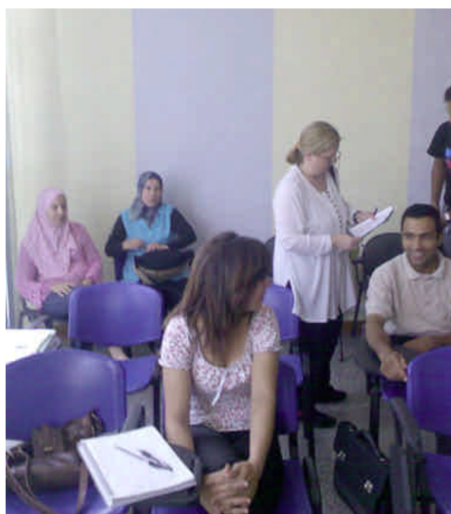
Uno dei circoli del ritorno a Roma