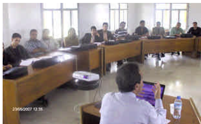
I beneficiari del corso di formazione in Marocco (Casablanca) durante una lezione