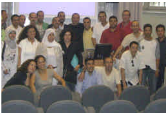
Il corsi di formazione a Torino