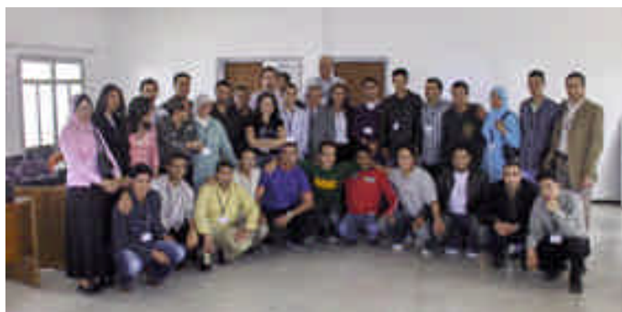
I beneficiari del corso di formazione in Marocco (Casablanca)

Nelle 65 ore di lezione in aula sono intervenuti ricercatori, esperti e operatori, che hanno incentrato i loro contributi, tra l'altro, su: gli ostacoli e i fattori di facilitazione alla partecipazione al Circolo migratorio; alcuni elementi di teoria e metodologie della progettazione; le opportunità offerte dal progetto per sostenere il percorso migratorio e l'inserimento lavorativo in Italia; il capitale sociale, la sua costruzione/ricostruzione, il suo ampliamento e la sua utilizzazione; le politiche, i soggetti e le strutture di sostegno all'integrazione e all'inserimento professionale nel paese di accoglienza.