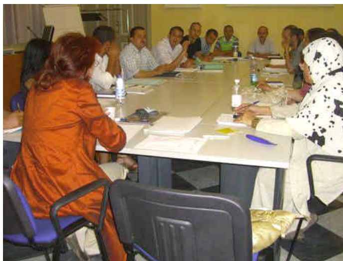
Uno dei circoli del ritorno di Torino

Nell'ambito dei corsi sono stati costituiti, in base agli interessi dei beneficiari, sei Circoli del ritorno (quattro a Torino e due a Roma) che si sono incentrati sulla possibilità di dare vita a iniziative di: creazione d'impresa (2 circoli a Torino e 1 a Roma); cooperazione allo sviluppo (1 a Torino e 1 a Roma); reinserimento lavorativo (1 a Torino). I circoli hanno avuto la funzione di favorire il confronto e la discussione tra i partecipanti, organizzati per piccoli gruppi, circa le principali questioni, gli ostacoli e le procedure necessarie alla progettazione e all'implementazione di iniziative specifiche di "ritorno costruttivo". Il lavoro dei Circoli è stato svolto, sia in aula attraverso riunioni e laboratori, sia a distanza mediante la realizzazione di "gruppi di discussione" virtuale su internet. I circoli del ritorno hanno dato vita, in un secondo momento, a una conferenza elettronica su "Migrazione e ritorno".