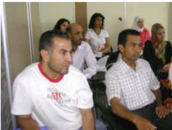
Una lezione in aula a Roma

Tra gli altri, sono stati offerti ai beneficiari contributi relativi a: gli ostacoli e i fattori di facilitazione alla partecipazione al circolo migratorio; la progettazione di iniziative di ritorno; le opportunità messe a disposizione dal progetto per sostenere tali iniziative; il capitale sociale, la sua costruzione/ricostruzione, il suo ampliamento e la sua utilizzazione; la cooperazione allo sviluppo e la cooperazione decentrata; la creazione d'impresa e il sostegno alla creazione di impresa.