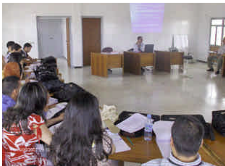
Una lezione in aula in Marocco (Casablanca)