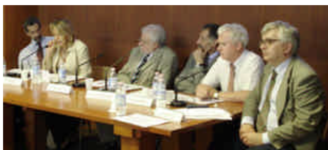
L'iniziativa "Roma città delle Nazioni Unite"

Il terzo numero di "Migrazioni e sviluppo" contiene le informazioni concernenti le attività svolte nelle ultime settimane del progetto "Migrations et retour: ressources pour le développement", la cui prima fase si sta avviando a conclusione (la seconda fase dovrebbe partire dopo l'estate). In particolare, le informazioni saranno incentrate sui due corsi di formazione realizzati in Italia e in Marocco, con particolare riferimento ai partecipanti, ai temi trattati, alle attività di didattica a distanza, nonché alla conferenza elettronica avviata nel contesto delle iniziative formative. Inoltre, nel bollettino vengono riportate le notizie maggiormente rilevanti relative alle restanti attività del progetto, nonché alcune informazioni circa avvenimenti e iniziative, esterni al progetto, ma riguardanti le migrazioni internazionali.